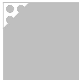
ORAFLEX® 11886 жесткий