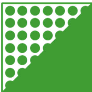
ORAFLEX® 11755EXP01 средний