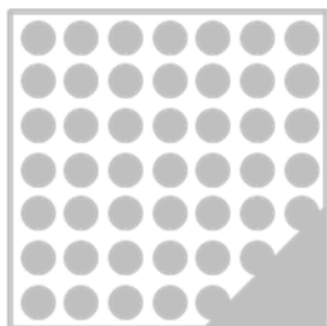
ORAFLEX® 11725EXP01 мягкий